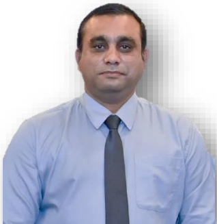
تَدْرِيسِي رَقْمِي رِسْرِي رَقْمِي رِسْرِي 3 سَوْرِي 2020