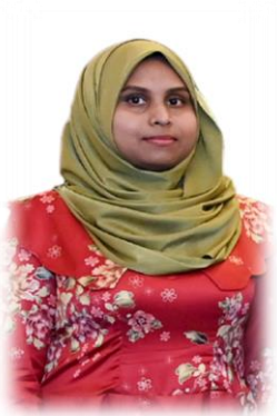
تَدْرِيسِي دُورِي رَقْمِي رِسْرِي 3 سَوْرِي 2020