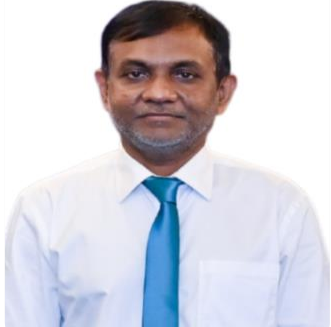
تَدْرِيسِي رَقْمِي دُورِي رَقْمِي 3 سَوْرِي 2020