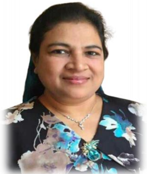
تَدْرِيسِي دُورِي رَقْمِي رِسْرِي 2 سَوْرِي 2018