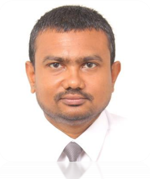
تَدْرِيسِي دُورِي دُورِي رَقْمِي 3 سَوْرِي 2020